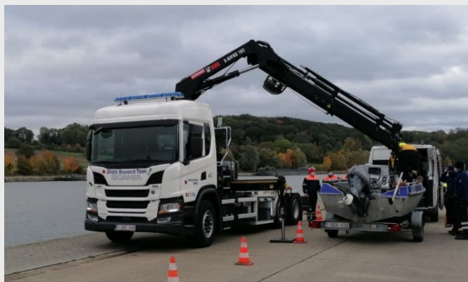
Le 7716, le camion grue qui permet de mettre les bateaux à l'eau

Outre les combinaisons, les masques faciaux, les palmes et les bouteilles à oxygène, l'équipe des plongeurs dispose d'une large gamme d'outils dans l'exercice de leurs missions. Notamment du matériel roulant et flottant.