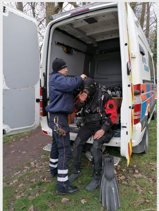
Le conteneur 4420, le vestiaire