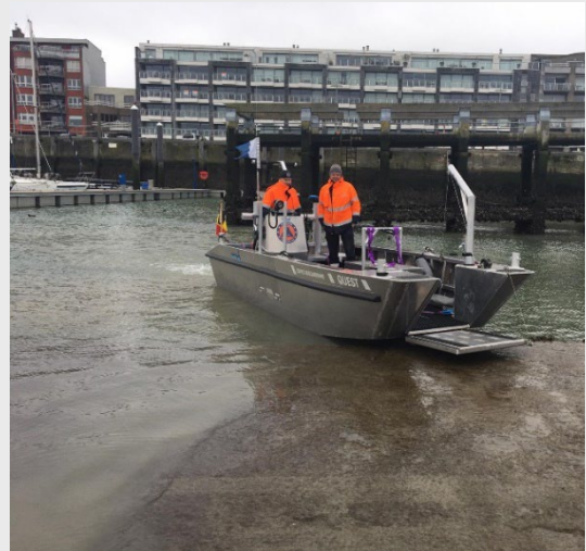
Le 3015, bateau pour la reconnaissance. Plus maniable que le 3012, il est muni d'un petit sonar qui permet de retrouver un véhicule