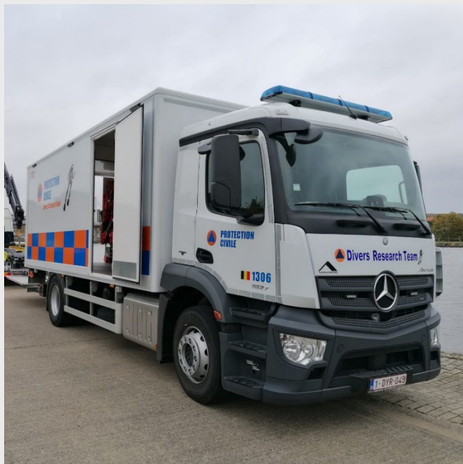
Le 1306, le camion cantine