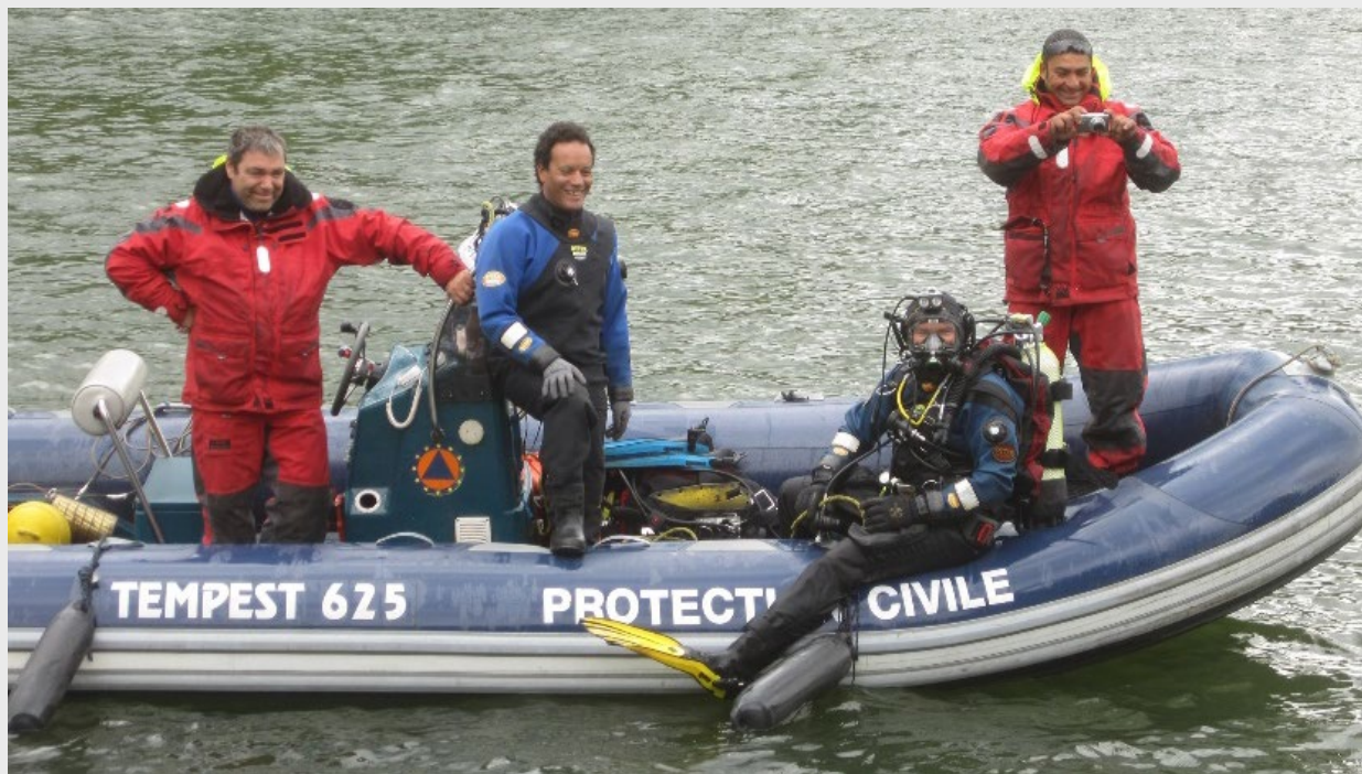
Le zodiac à moteur électrique pour le travail sur les étangs